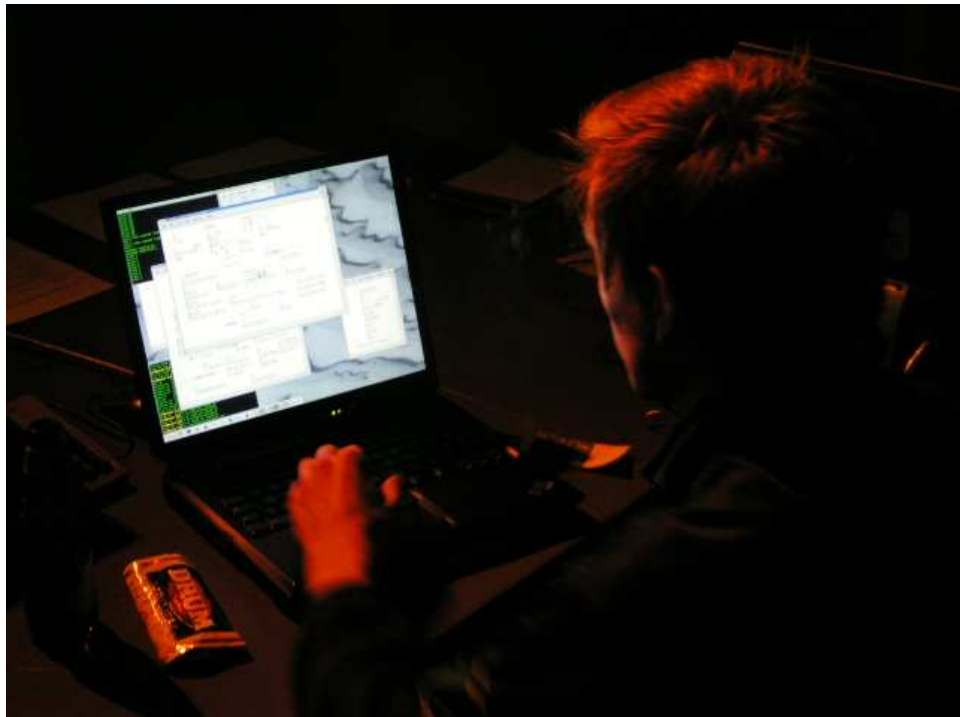
Abbildung 6.1: Programmierarbeiten by gullibloon.