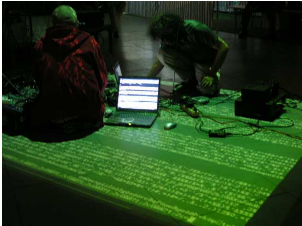
Abbildung 3.1: localtask Tempest Performance Dom im Berg.