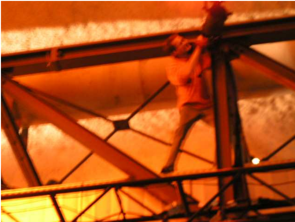
Abbildung 5.1: localtask Aufbauarbeiten im Dom im Berg.