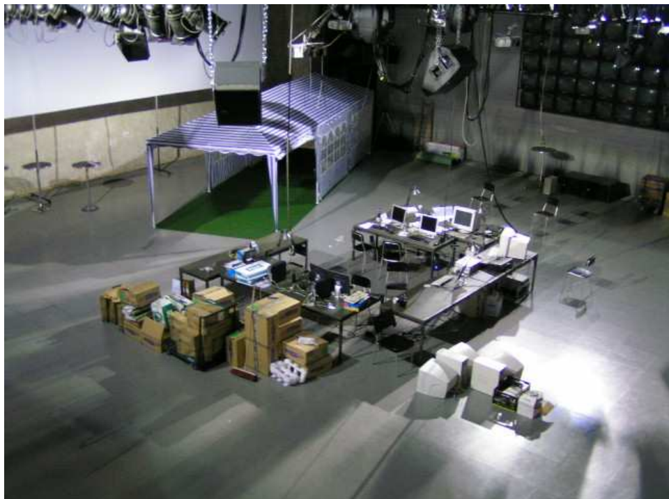
Abbildung 1.1: Aufbau des localtask worklab.